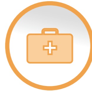
Central Venous Internal Line: Port